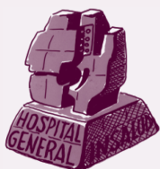
Hospital O. Polanco de Teruel