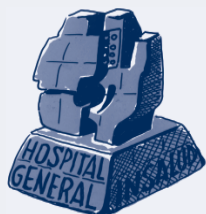
Hospital O. Polanco de Teruel

Que se puede encontrar como Inscripción al Memorial Jerónimo Soriano en el apartado Enlaces de interés de la Intranet del Sector Teruel.