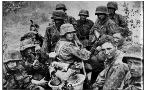
Figura 10. Algunos de los niños españoles se integraron en el ejército Rojo.

En febrero de 1939 pasó a Francia desde Cataluña como un miembro más del Ejército en retirada y estuvo internado dos meses en un campo de concentración del sur de Francia. Se exilió a la URSS, donde se incorporó