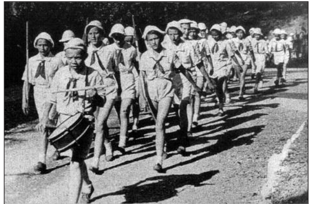
Figura 9. Niños españoles en Rusia, desfilando.