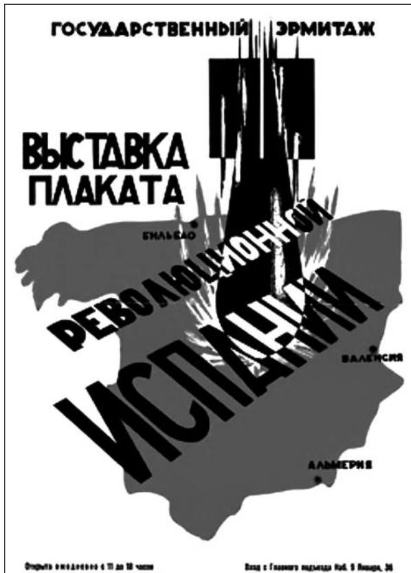
Figura 1. Anuncio de una exposición con carteles de apoyo a la República Española en el Museo del Hermitage de San Petersburgo.