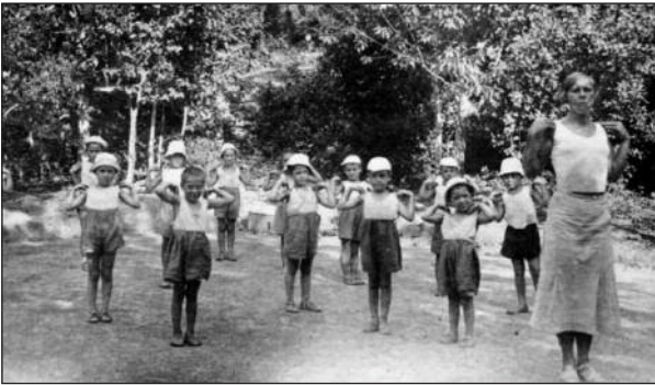
Figura 6. «Niños de la guerra» practicando gimnasia en una de las «Casas de niños» españoles en la URSS.