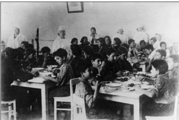
Figura 7. «Casa de niños» número 5. La hora de la comida. Moscú, 1939.