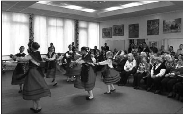
Figura 3. Los «niños de la guerra». Los pocos que quedaban en Rusia de más de 3.000 menores españoles que fueron evacuados durante la Guerra Civil a la Unión Soviética, celebraron en esta jornada el 75 aniversario de la llegada al país que ya nunca llegarán a abandonar.

Lo único que compartían casi todos era su militancia comunista. El PCE era un partido minoritario al comienzo de la Guerra Civil, con escasa implantación en la clase médica y el fuerte crecimiento que experimentó durante la contienda no se acompañó de una penetración significativa en el mundo sanitario. Entre los médicos que emigraron a la Unión Soviética, unos pocos eran viejos militantes de los años veinte o del comienzo de la II República, pero la mayoría se incorporó al Partido, al inicio de la contienda o pocos meses antes. Entre los más jóvenes predominaban los que habían pertenecido a la FUE, el sindicato universitario de izquierdas.