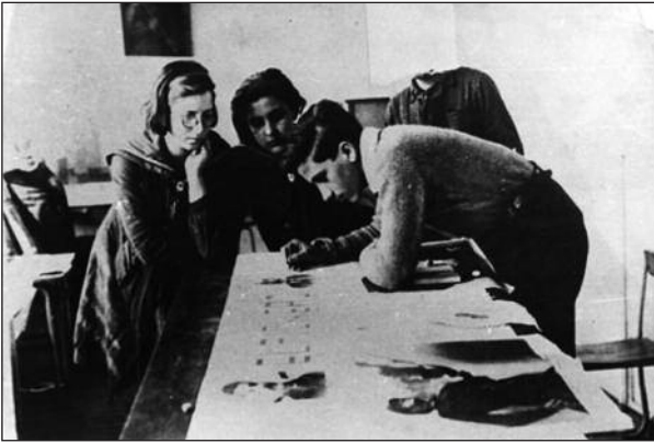
Figura 5. Haciendo un periódico mural. «Casa de niños» número 5. Moscú, 1939. Donación del Centro de España en Moscú. Fundación F. Largo Caballero.