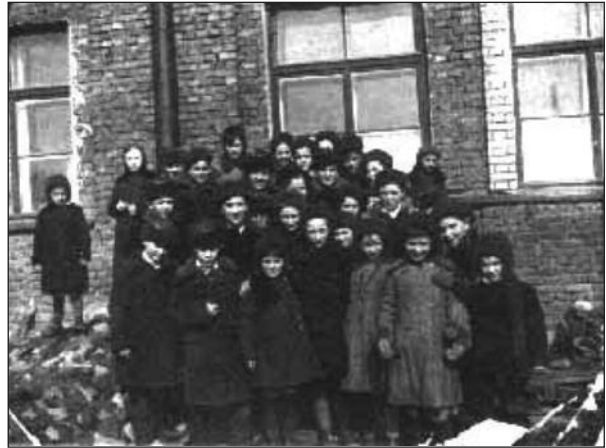
Figura 8. «Casa de niños» número 9. Leningrado.