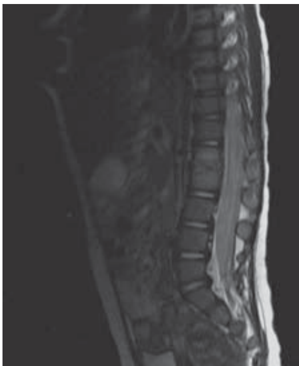
Figura II. RM de columna completa. Se observa afectaci3n del disco y paravertebral en espacio L1-L2.