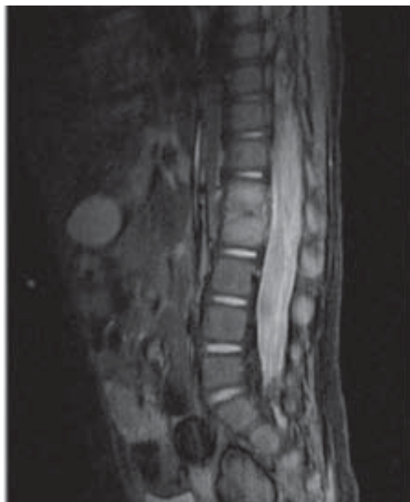
Figura III. RM de columna completa. Alteraci3n a nivel del disco y paravertebral en L1-L2.

sedestaci3n y en la adolescencia como dolor lumbar o cervical. Se puede acompa~nar de sintomatolog~a inespec~fica como fiebre, irritabilidad y/o dolor abdominal (4) .