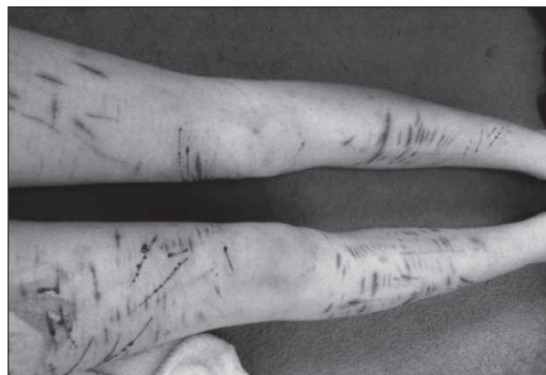
Figura 2. Autolesiones múltiples en extremidades inferiores.